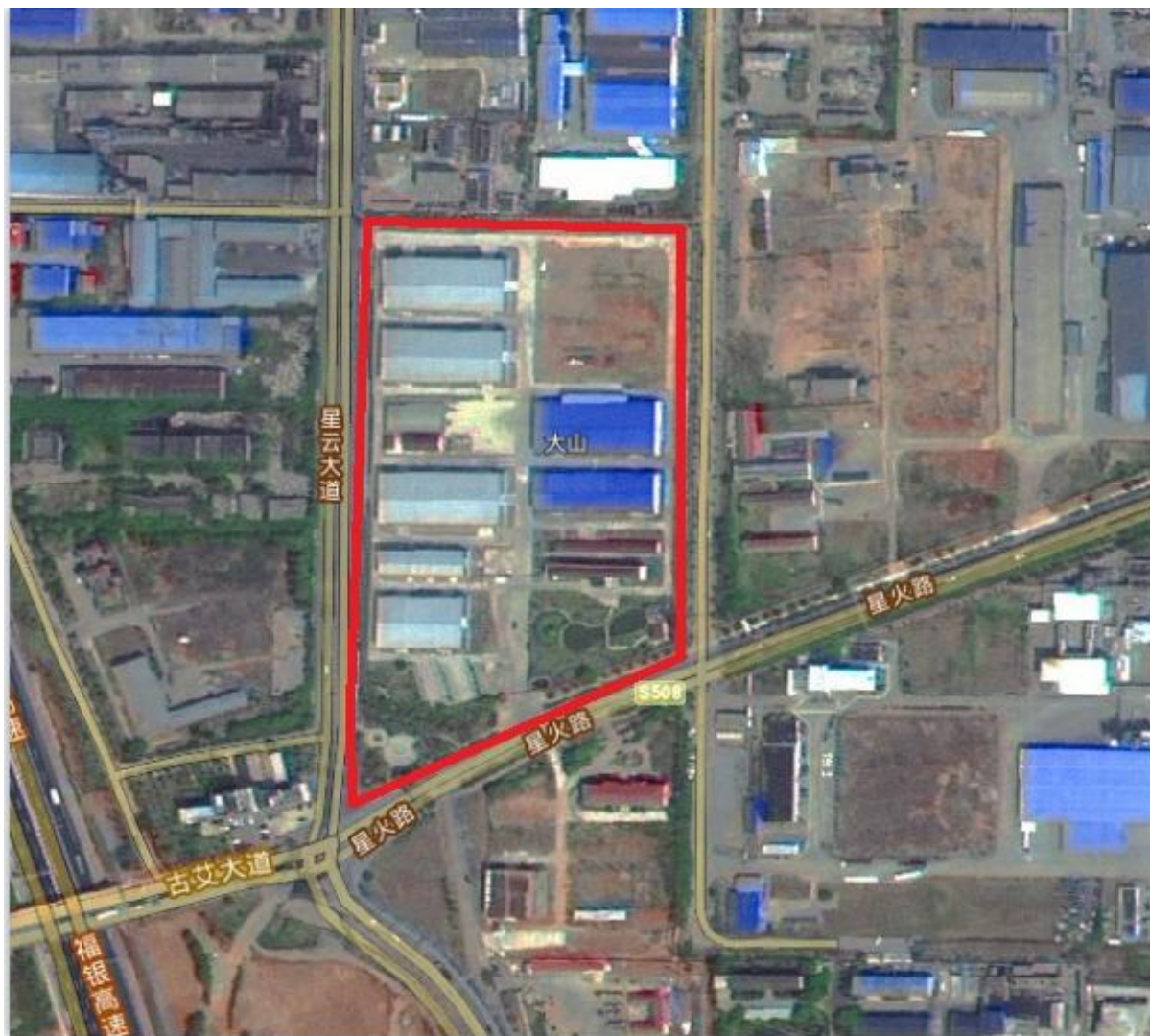
图 2.2-1 该项目地理位置图